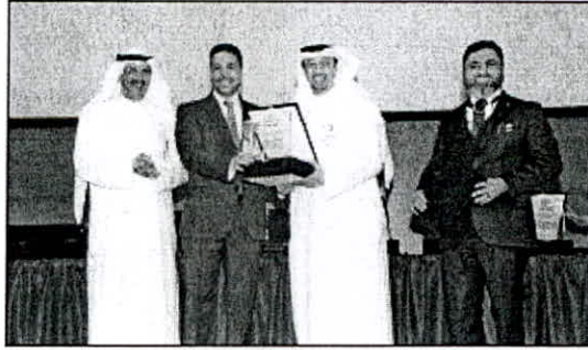
• الزينكي يكرم أحد الطلاب

وبهذه المناسبة تقدم الأثري بالشكر لإدارة المعهد والعاملين فيه من أعضاء هيئة التدريب والإداريين على مجهودهم خلال فترة العام التدريبي. مؤكداً أن جهودهم المخلصة هي التي ساهمت في تحقيق أهداف وإنجازات المعهد لهذا العام. متمنياً لهم التوفيق والمزيد من العطاء بما يصب بصلحة